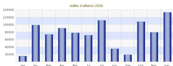
Evolution du CA annuel

Toutes ces questions trouvent leur réponse dans Téo sans aucune manipulation. Il suffit de consulter le tableau de bord adéquat !