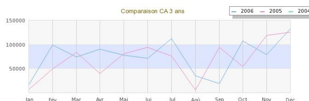
Comparaison du CA sur 3 ans